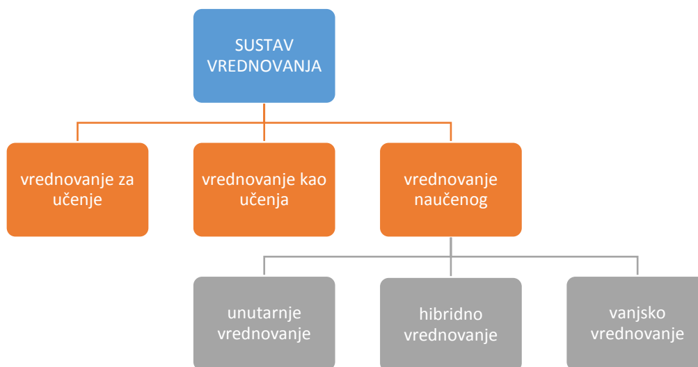
Slika 3. Pristupi i oblici vrednovanja učeničkih postignuća i napredovanja

Vrednovanje za učenje i vrednovanje kao učenje služe za unapređivanje učenja i prilagođavanje poučavanja, a vrednovanje naučenoga upotrebljava se za procjenjivanje i izvješćivanje o postignućima i napredovanju na kraju određenoga odgojno-obrazovnog razdoblja (nastavne cjeline, polugodišta, razreda itd.) u odnosu na kurikulumom definirane ishode. U vrednovanju naučenoga razlikujemo tri oblika vrednovanja ovisno o tome tko osmišljava, planira i provodi vrednovanje (učitelj ili vanjska institucija), a to su unutarnje , hibridno i vanjsko vrednovanje .