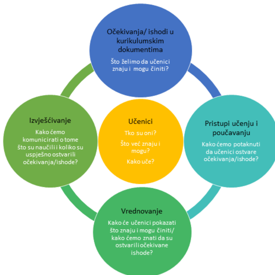
Slika 1. Povezanost i usklađenost različitih sastavnica kurikulumskoga sustava

Uz kurikulumske dokumente i procese učenja i poučavanja, vrednovanje i izvješćivanje o učeničkim postignućima i napredovanju predstavlja treću ključnu sastavnicu kurikulumskoga sustava. Pojedine su sastavnice međusobno povezane i jedna na drugu djeluju, kao što je prikazano na slici 1.